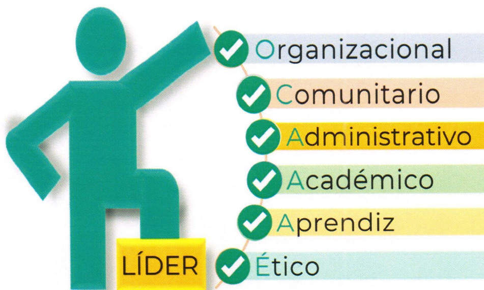
Diagrama 1: Elementos del líder OCA 3 E

El diagrama 1 1 presenta los elementos del concepto sobre el líder OCA 3 E. Las siglas corresponden al director de escuela como líder organizacional, comunitario, administrativo, académico, aprendiz, ético. Los Estándares profesionales del director de escuela están enmarcados en estos elementos.